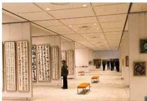
東根市芸術文化協会のみなさまの活力ある作品の数々。

東根市芸術文化協会の方々の作品が一堂に会する市民芸術展「はじまり」が市民ギャラリーにて3/18～26の期間開催されました。