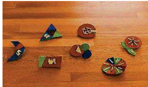
鹿皮とヤマアラシの針を使ったブローチが完成しました。