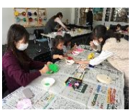
ワークショップ 運営補助

対象：〈一般サポーター〉 18歳以上 (東根市外在住でも応募可) 〈ティーンズサポーター〉 中学生・高校生 (東根市外在住・在学でも応募可)