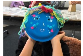
りぼんをつけたキュートなおにのお面が完成！

毎年恒例の「おにのお面づくり」ワークショップを開催し、節分に向けて親子で世界に一つだけのお面づくりに挑戦しました。紙皿や毛糸、スタンプ手作りの表情スタンプなどから材料をじっくり選び、絵本に出てくる鬼やスタンプ手作りの見本の鬼のお面を参考に、どんな鬼にするか親子で相談しながら制作をスタートしました。子どもだけではなく、お父さん、お母さんもとっても真剣！難しいところはまなびあテラスサポーターもお手伝いし、個性あふれる素敵な鬼のお面が完成しました！