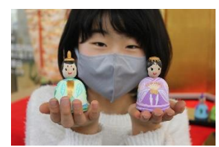
親子でがんばって描いたひなこけしは愛らしいものばかり。

一足先に春を感じることができました。完成品はエントランスに展示し、来館者を楽しませてくれました。