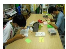
図書館POP作成 (ティーンズサポーター限定)