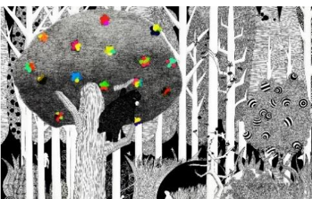
〈 Forest 森 〉 2015年