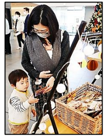
ハニカムボールと、タッセルの2種類！

エントランスホールにて、おうちで簡単に作れる、可愛いクリスマス装飾のキットを無料配布しました。