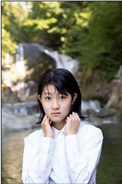
東根市在住・在学のティーンズからモデルを募集した《未蓄(みらい)プロジェクト》の中の一作。