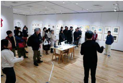
オープニング対談にはながさわさんの同級生をはじめ、たくさんの方が集まってくれました。

今回のメイン作品「オレ新聞」が、「毎日・オレ新聞」として毎日新聞山形版に毎日掲載されています。エントランスホールに貼り出していきますので、展示と合わせてご覧ください。