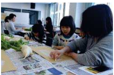
個性あふれる大根が完成しました。

和紙を使って、自由に表現しました。最後に、参加者みなさんで完成した作品の鑑賞会を行いました。どの作品も、色彩豊かなちぎり絵で、大根のみずみずしさをうまく表現していました。