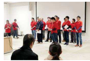
東根市商工会青年部のみなさん