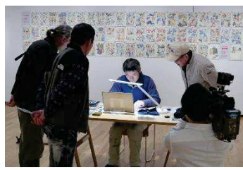
展示期間中は、ながさわさんが館内で作品を描く様子を直に見ることが出来たり、直接ご本人と作品についてお話しすることもできます。

会期：1月13日「土」↓2月12日「月・祝」 開館：9時〜18時 休館日：1/22(月) 会場：特別展示室