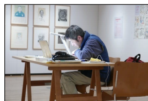
2018年 個展「オレ新聞」より▲ 《愛の近田春夫》 鉛筆画、サイン 76×58cm