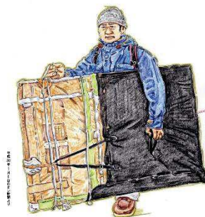
ながさわたかひろの「オレ新聞」が東根に帰ってくる！