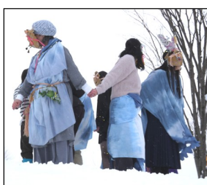
◀▶ ワークショップ・ 成果発表の様子

まなびあテラスを舞台に、演出家と一緒に創作していく参加型プログラム「まなびあテラスパフォーミングアーツプログラム」を開催しました。 初回となる今回のテーマは「パレード」。プロの演出家と俳優のもと、総勢十六名のワークショップ参加者が、三日間かけてパレードを作り上げました。アイディアや衣装、小道具も全て参加者がワークショップで作り出したもの。ダンボールでそれぞれ好きなものをモチーフにしたお面を作り、大きな布を自分たちで染めて加工して衣装を制作していききました。演劇のワークで出たたくさんさんのアイディアや動きを繋ぎ合わせ、自分たちの「パレード」を表現しました。 当日パレードの参加者となった六名は、約四十名の観客が見守る中、屋外にもくり出す四十五分のパフォーマンスを演じ切り、作品を通して鑑賞者との交流も楽しみました。 ワークショップの内容や上演の記録映像は、二月二十一日より開催のドキュメンタリー展「Exhibition パレードー」にて公開されます。こちらでもぜひお楽しみください。