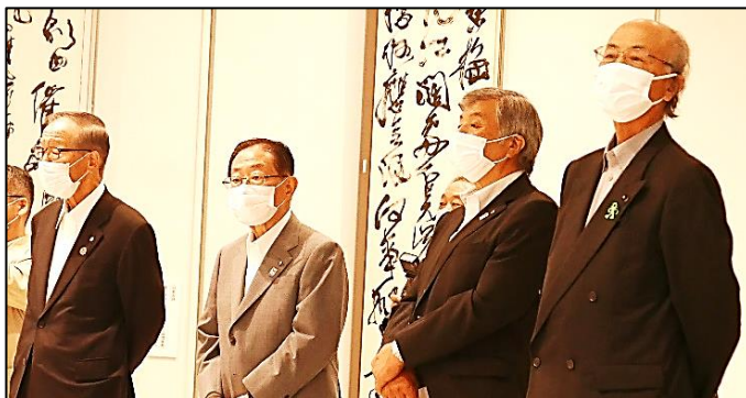
ご来館いただいた関係者の方々。