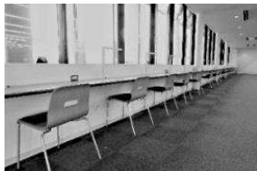
図書館内 閲覧スペース

利用対象: 図書館の資料を利用して、研究・調査・閲覧をされる方。 持ち込み学習はできません。