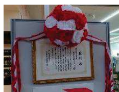
表彰状はまなびあテラス図書館入り口に 掲示中です。